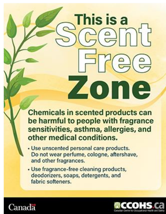
カナダのポスター This is a Scent Free Zone （ここは無香料のエリアです）