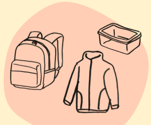
ナイロン・ポリエステル プラスチックなど せきゆ せいひん (石油ゆらいの製品)

いちど かの き 一度ついた香りは、消えるわけではなく あら と 洗ってもなかなか取ることができません。