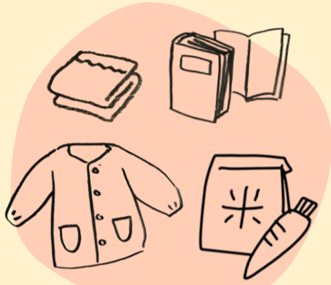
いるい かみ しょくひん 衣類・紙・食品 せんい かの す (繊維が香りを吸いやすい)